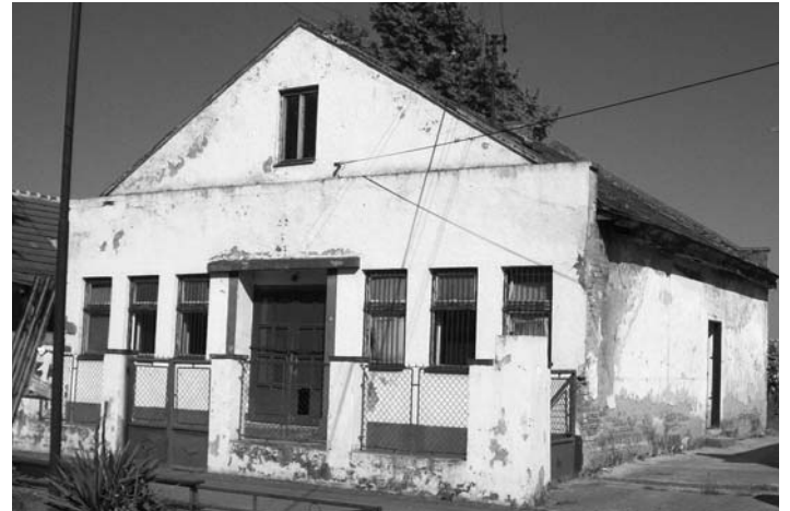
A Községi Nemzeti Bizottság régi épülete

tasztrófális vízügyi helyzet miatt önti el évente kétszer a csak gumicsizmában járható sártenger. Ráadásul a rendszeres áradások tönkreteszik a házakat is, hosszútávon vagyoni és biztonsági kér-