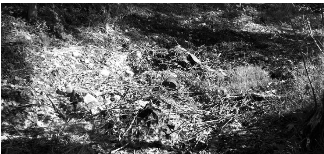
A papszegi kanális szeméttel teli, kiszáradt medre

csak lakhely, de élőhely is. „Mindenkinek felelős a saját sorsáért.” – mondja. Úgy véli, a falu lakóinak is szembe kell nézniük azzal, hogy bár jogosan követelik meg az őket illető részt a város kasszájából, az életszínvonaluk elsősorban saját magukon múlik. Hiányolja a