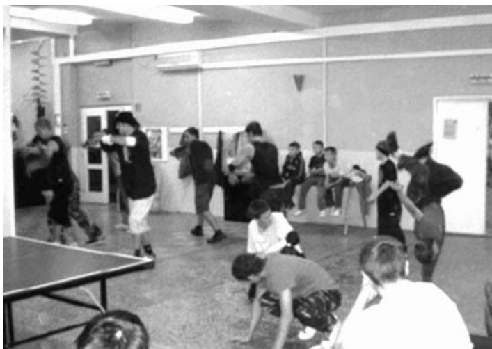
Próbál a United Powers

mint a gyermekotthonnal is. Alkalmanként – elsősorban a szabadtéri rendezvények alkalmával – a cserkészszövetséggel is együttműködnek. A központ talán legemlékezetesebb szabadtéri rendezvénye a kihívás napja volt, ahol a résztvevők ügyességi és akadályversenyen mérhették össze az erejüket, este pedig tábor tűz melletti sütéssel vezették le a napot. A pingpongversenyeken kívül szerveznek foci- és kosárlabda bajnokságokat és túrákat is. Nem csak a városban, de a járásban is egyedülálló, ahogy az ifjúsági központ bekapcsolódik a nemzetközi gyerek- és diákprogramokba. Az oktatási minisztérium égisze alatt futó Fiatalok lendületben program keretében Európa jónéhány országából fogadtak már, és még több helyre küldtek ki önkénteseket, akik a megyerihez hasonló ifjúsági központokban vagy diák-táborokban dolgozhatnak. Ez páratlan lehetőség, hiszen az önkéntesek szervezett és biztonságos körülmények között járhatnak be távoli országokat Portugáliától Törökorszáig, megismerhetnek idegen kultúrákat, összeharatózhatnak olyanokkal, akikkel egyébként nem